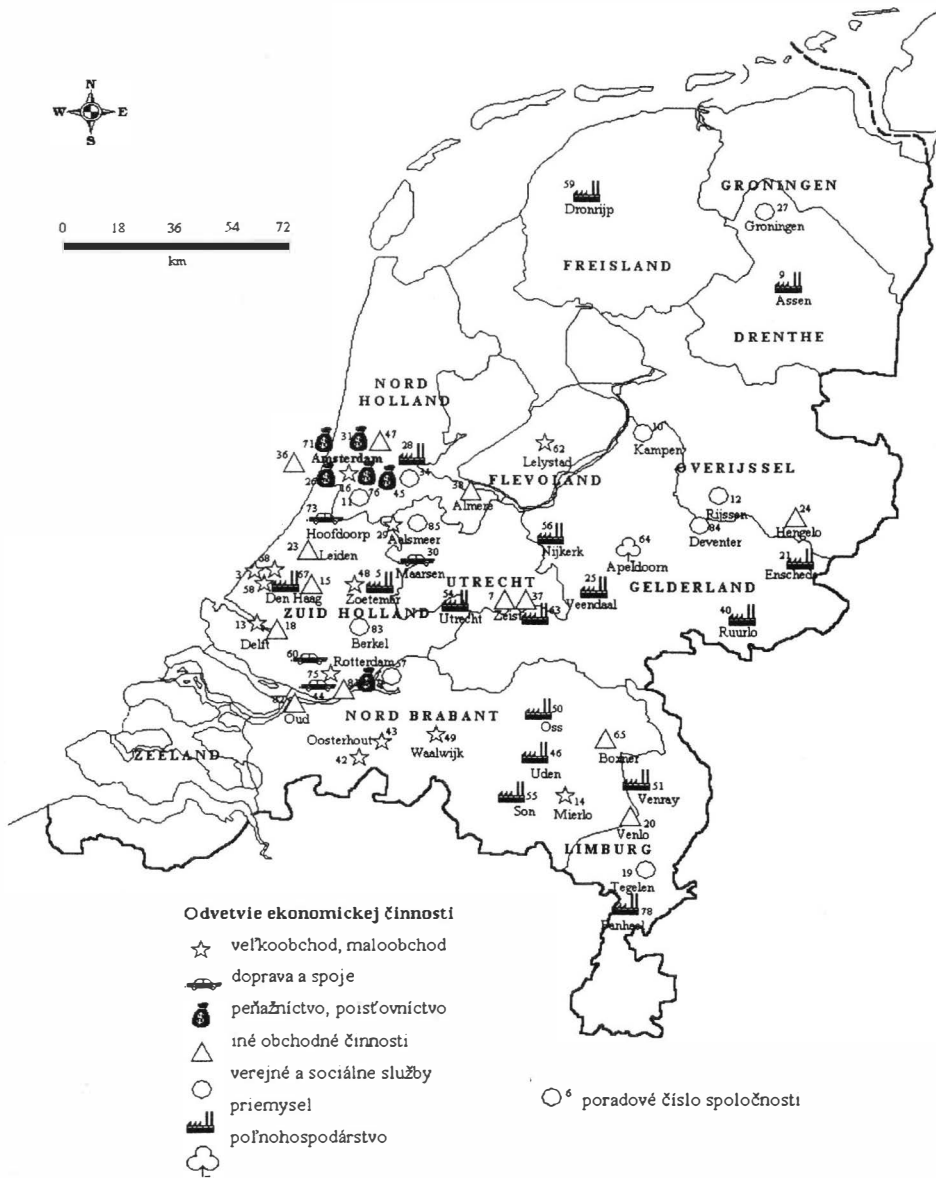
Mapa 2 Pôvod registrovaných holandských spoločností pôsobiacich v SR v roku 2000